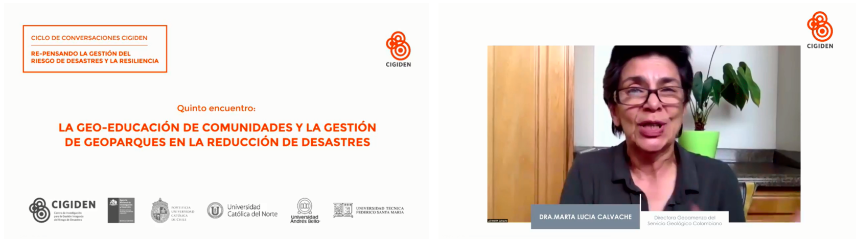
Imagen 2: Conversatorio en La Geo-Educación de comunidades y la gestión de Geoparques en la RRD